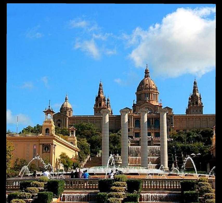
Museo Nacional d'Arte de Catalunya