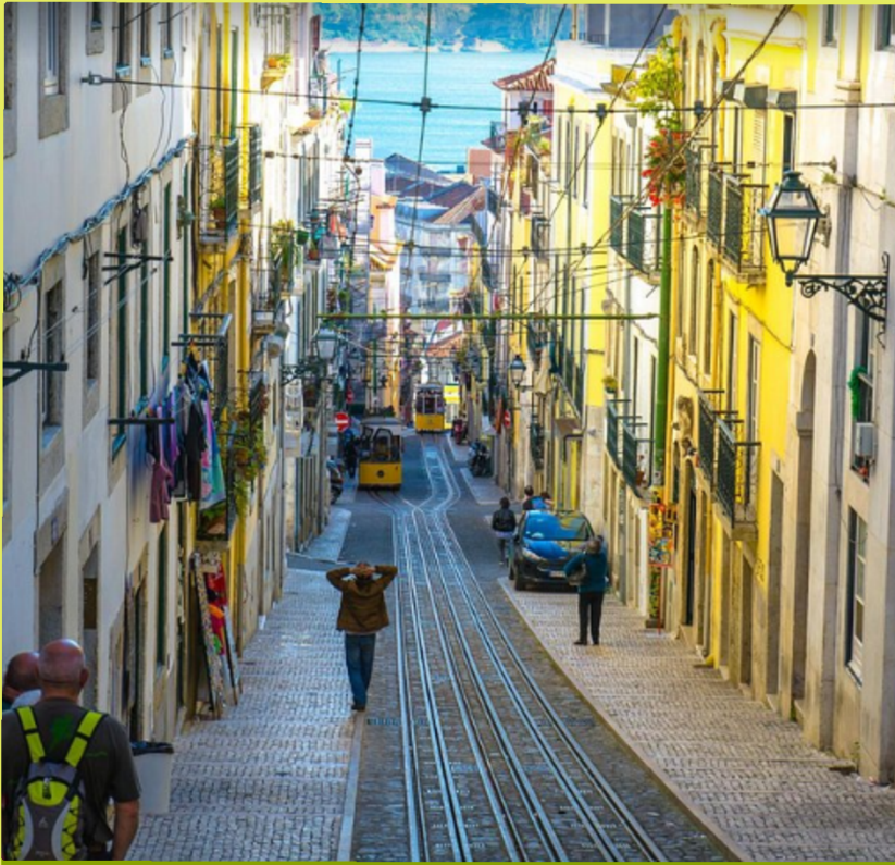
Barrio Alto Lisboa