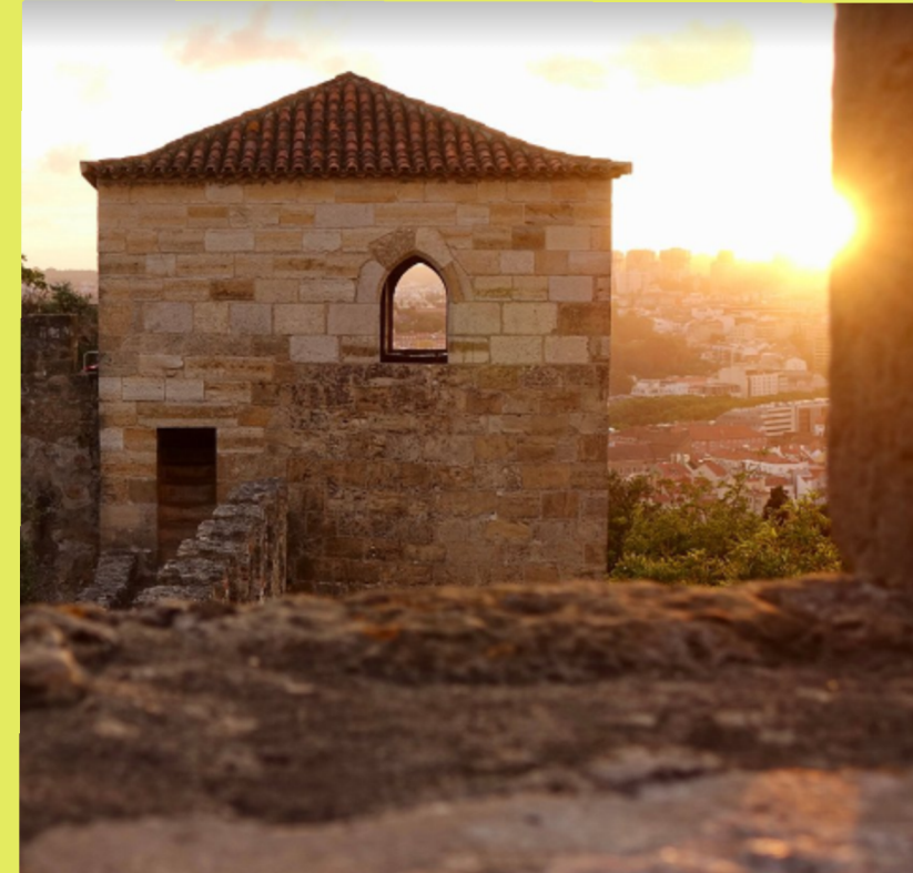
Castillo San Jorge