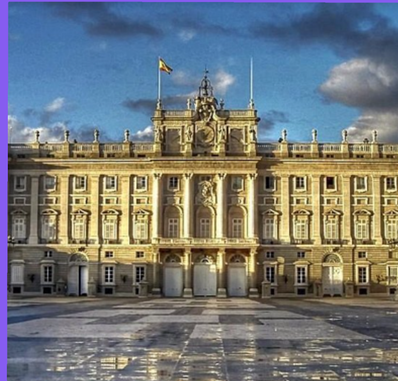
Palacio Real Madrid