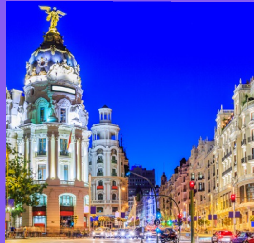
La Gran Vía