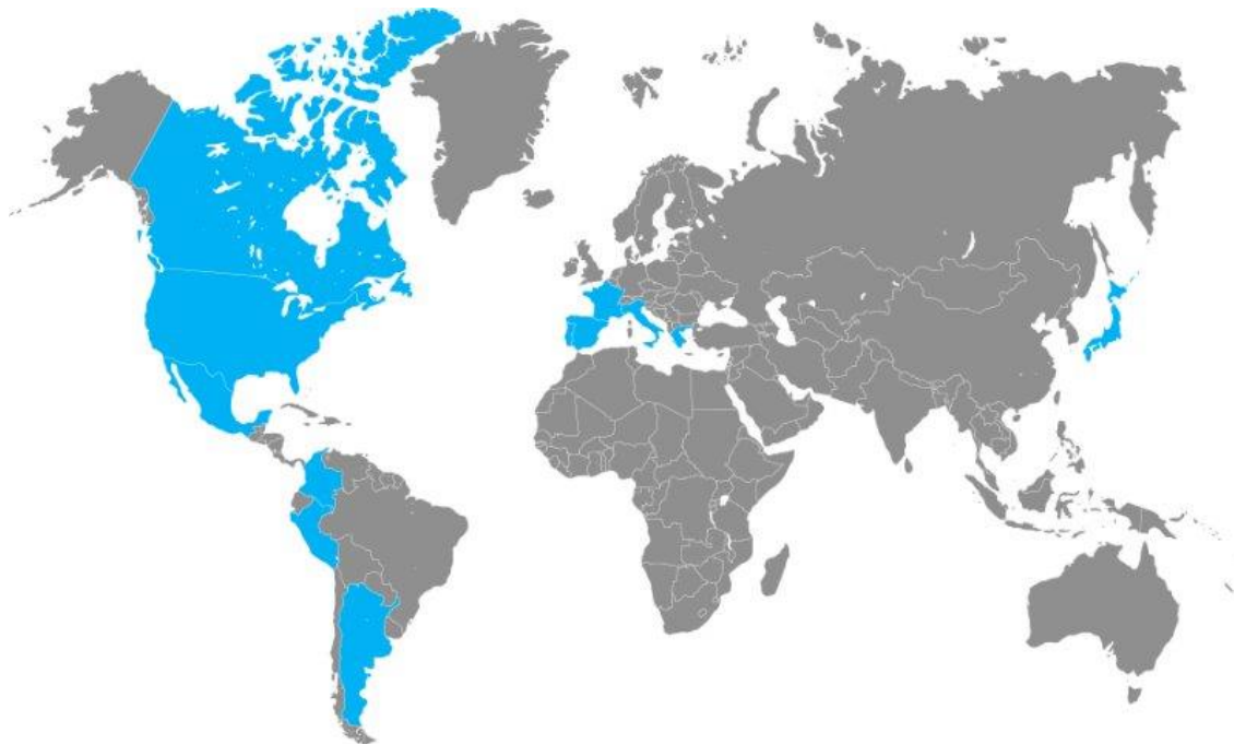
Imagen 6.2 Apertura de nuevos destinos de movilidad 2023