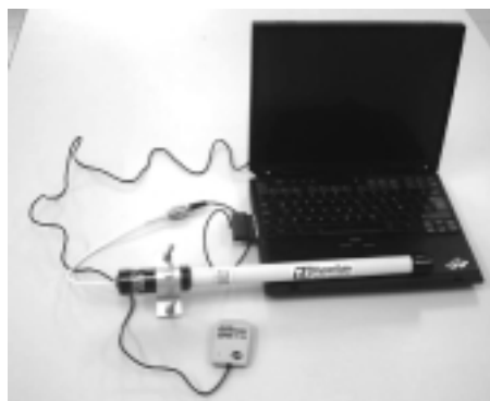
Figura 1. Equipos utilizados para el estudio de WarDriving.

De acuerdo con las experiencias de WarDriving en otros países, el grupo investigador se equipó con un portátil con una tarjeta inalámbrica 802.11b conectada a una antena externa de gran ganancia, junto a un sistema GPS de uso civil. La Figura 3 muestra el equipamiento seleccionado para realizar el estudio de WarDriving. Para el estudio de áreas específicas con WarWalking se utilizó una PDA con conectividad inalámbrica Wi-Fi.