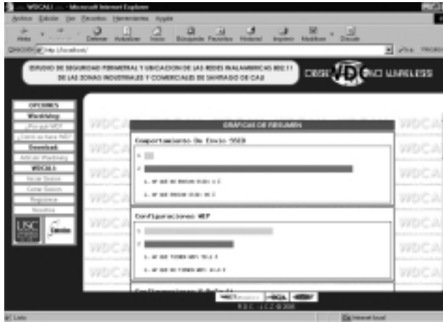
Figura 3. Herramienta Web denominada WDCali para la presentación de los resultados del estudio.