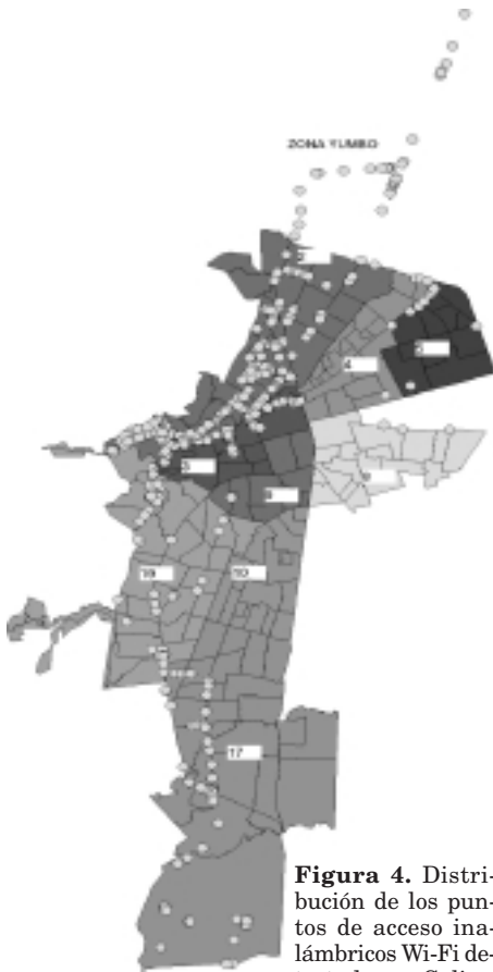
Figura 4. Distribución de los puntos de acceso inalámbricos Wi-Fi detectados en Cali.

gunos de los puntos inalámbricos configurados WEP están por defecto, además el protocolo WEP no es confiable si no se utilizan políticas de actualización de la clave (WEP dinámico).