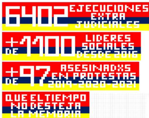
FIGURA 4 | Proyección digital de las 4 piezas a elaborar por el colectivo