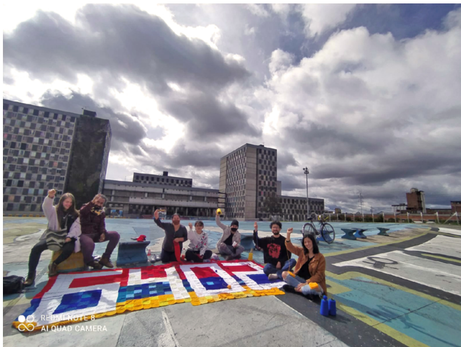
FIGURA 2 | Tejedores de Resistencia en Plaza de la Hoja (1 de agosto de 2021)

Entre agujas, marchas, plantones, juntanzas y conversas virtuales, el colectivo TdR viene elaborando cinco grandes piezas textiles a muchas manos, creando redes de apoyo en varios puntos del territorio colombiano, a través de las cuales se han venido entramando palabras, ideas, sensaciones y pensamientos, de los cuales quisiera aquí ofrecer algunas puntadas que han sido tejidas en conjunto con Pipe, Anny, María, Mich, Anne, Em, Aida y muchos otros que se han unido a este proyecto (Figura 2). Así, este texto responde más a un nosotros que a un yo; agradezco a todos por los encuentros desde la distancia 1 .