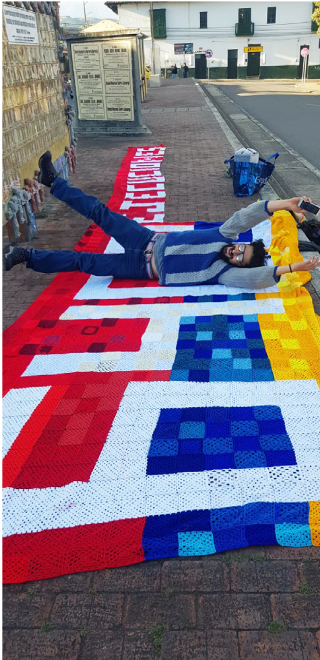
FIGURA 14 | Tejedores de Resistencia en Tunja (15 de agosto de 2021)