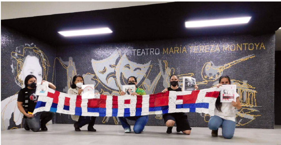
FIGURA 13 | Tejedores de Resistencia en Ciudad de México (18 de julio de 2021)