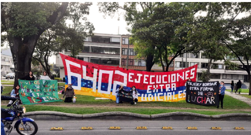
FIGURA 9 | Juntanza de arte textil y resistencia en Parkway (20 de septiembre de 2021)