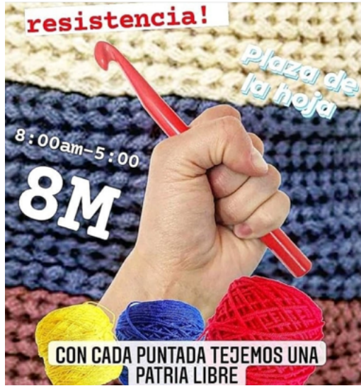
FIGURA 3 | Primer cartel de convocatoria Tejedores de Resistencia (mayo de 2021)

la bandera deberían invertirse, que no debería ser una sino 4 piezas textiles (Figura 4), y que cada una de ellas contendría un mensaje que abordara un gran caso de violencia sistemática ejercida por el Estado.