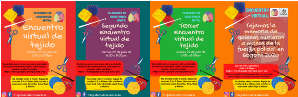
FIGURA 6 | Carteles convocando a encuentros virtuales (junio-septiembre de 2021)

TdR ha venido trabajando con otras iniciativas textiles, con otros procesos sociales, al tiempo que se plantea nuevos trasegares. Al momento de escribir este artículo (junio de 2022), se ha terminado una de las piezas propuestas, se creó una pieza no contemplada inicialmente (Figura 7) que aborda el tema de la desaparición forzada y, en total, se han tejido cerca de 5000 cuadritos o granny square .