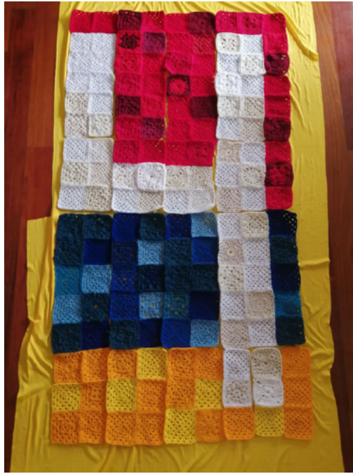
FIGURA 8 | Tonalidades, materiales y puntadas diversas (25 de junio de 2021)