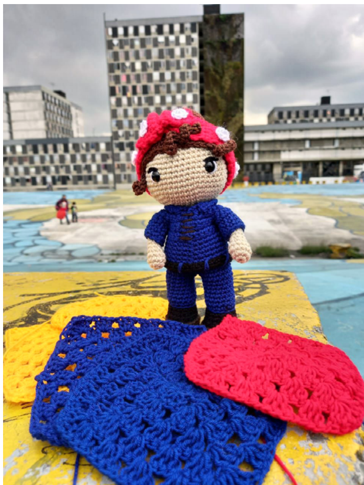
FIGURA 5 | Primeros encuentros en Plaza de la Hoja (13 de mayo de 2021)

La invitación a tejer 6402 carpetas de crochet como un acto de resistencia se fue enriqueciendo en cada encuentro (Figura 5), en la marcha, en Portal de la Resistencia, en las localidades, en Usme, Ciudad Bolívar, Suba, al norte y al sur, convirtiéndose en oportunidad para recordar esos 6402, y para preguntarse por los que aquí no se cuentan, por las violencias en los barrios, los muertos olvidados, los silenciados y, a la vez, ser un espacio para contar las historias propias, esos recuerdos de quienes los conocieron, de los lugares que habitaron, de las historias que por esas calles transitaron, los prejuicios, las dudas, el interés por conocer esa parte de la historia que no se cuenta en noticieros.