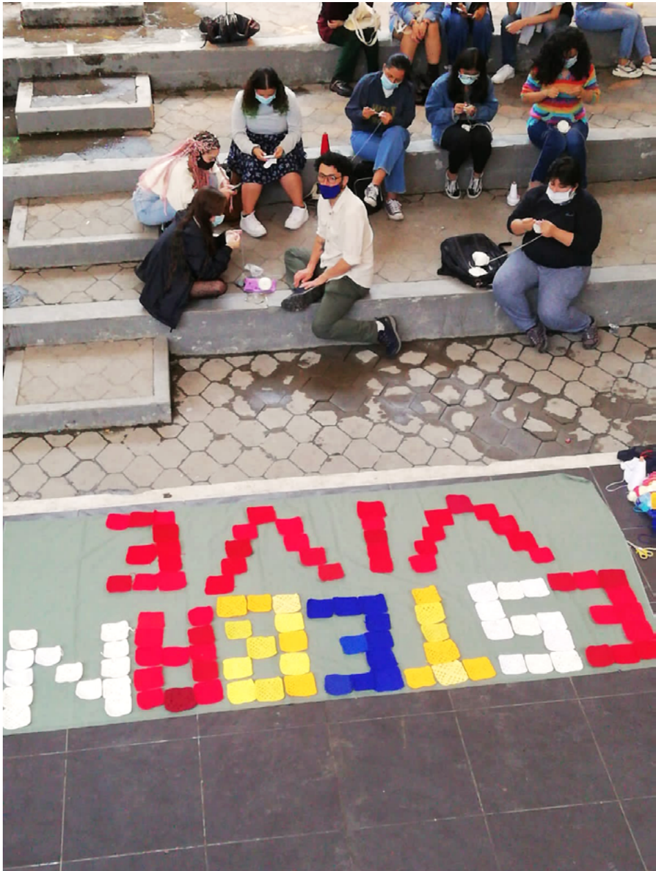
FIGURA 15 | Tejedores de Resistencia en Popayán (24 de agosto de 2021)