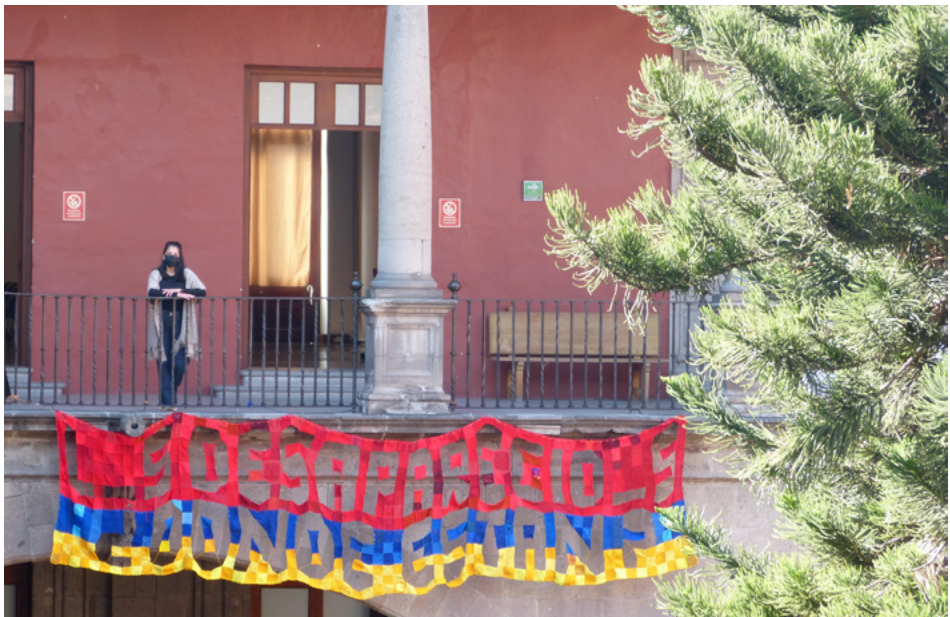
FIGURA 7 | “L_s desaparicid_¿Dónde están?”, pieza textil TdR (enero de 2022)