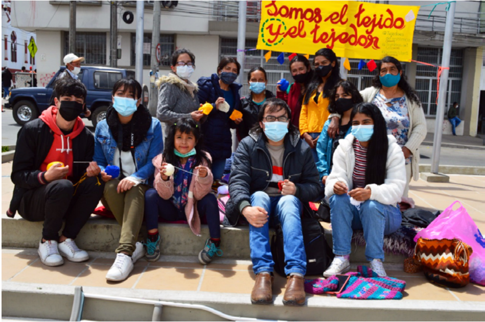
FIGURA 12 | Tejedores de Resistencia en Túquerres (21 de agosto de 2021)