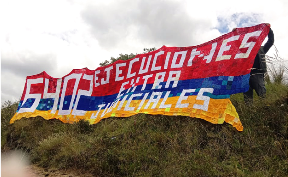
FIGURA 10 | Primera muestra de la bandera, Mondoñedo (28 de agosto de 2021)