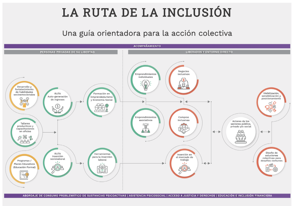
FIGURA 3 | Presentación institucional de LR

El desarrollo de capacidades busca brindar herramientas teórico-prácticas que posibiliten ampliar el espectro de oportunidades presentes y futuras de la población carcelaria y su entorno directo a través del desarrollo y fortalecimiento de habilidades socioemocionales, capacitaciones en oficios y programas educativos. En cuanto al desarrollo económico, LR se orienta a brindar herramientas y fortalecer capacidades específicas para la inserción económica de las personas detenidas, liberados y sus familiares a través de la inserción laboral en el mercado de trabajo o mediante los emprendimientos individuales o asociativos.