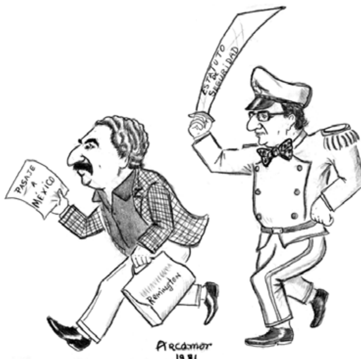
FIGURA 1 | El exilio de Gabriel García Márquez