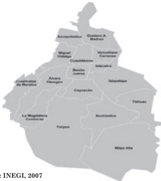
Figura 1. Organización política por delegación en el Distrito Federal

En el Cuadro 3, se puede observar que la delegación Iztapalapa contribuye con el 16% al total de unidades económicas ubicadas en el Distrito Federal y con el 10% de empleos.