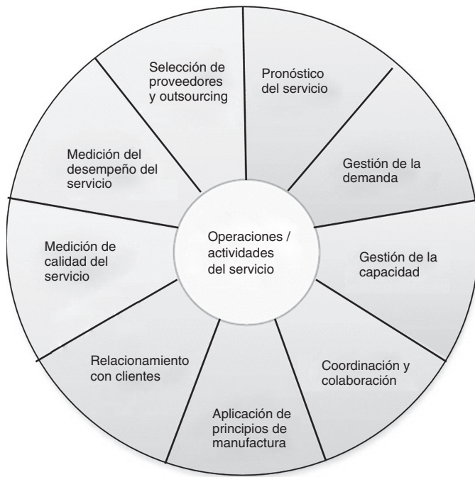
Figura 2. Actividades detalladas de las empresas de servicios. Fuente: tomado de Sakhuja y Jain (2012, p. 221).

producir, a la planificación de los recursos requeridos para la entrega del servicio (por ejemplo, personas, equipos, tecnología). En compras y abastecimiento, los retos cambian de la gestión de materias primas y material de empaque y sus proveedores, a la gestión de los espacios físicos, los recursos o los insumos de apoyo requeridos para la prestación del servicio y sus proveedores. En transformación, los retos pasan de la manufactura física del producto a los retos de gerencia de proyectos, donde la definición de alcance y de recursos es relevante, así como la calidad en la ejecución, la definición y cumplimiento de los niveles de servicio, la gestión de contratos y los momentos de verdad con el cliente. En transporte, los retos están más relacionados con el flujo de información que con el flujo físico, es decir, se vuelve relevante gestionar los documentos y la trazabilidad de los servicios, logrando mantener una alta comunicación con el cliente que se deriva en un nivel de satisfacción más alto.