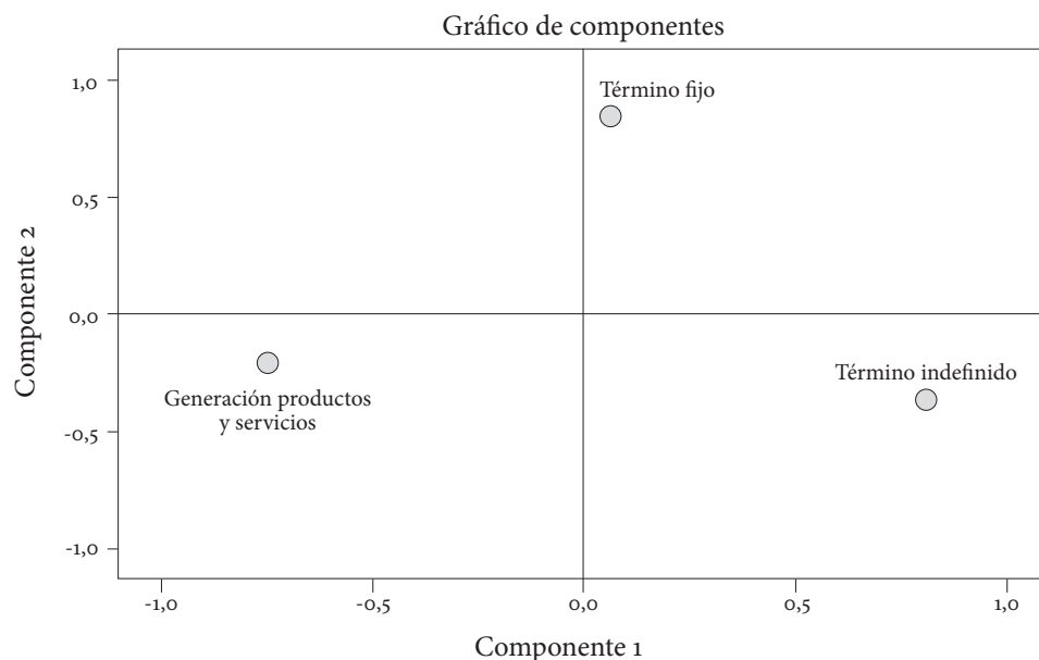
Gráfico 2. Componentes principales del análisis factorial