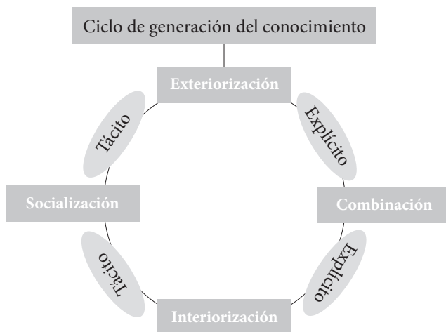
Gráfico 1. Ciclo de creación del conocimiento