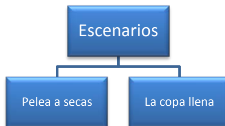
Gráfico 2. Escenarios propuestos.