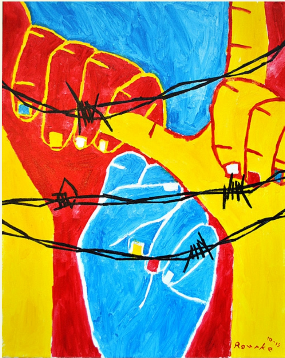
Respect ASL . Nancy Rourke (2015)