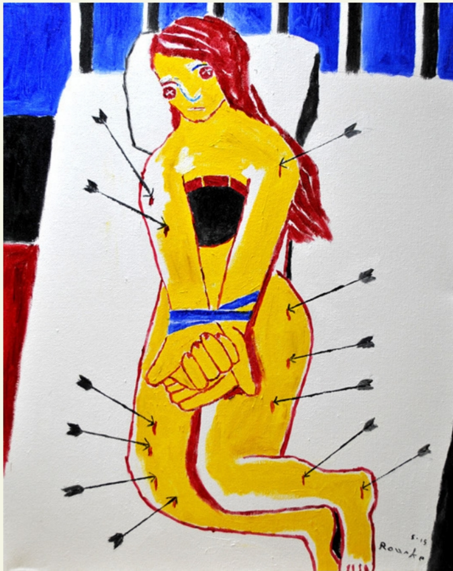
Oppression . Nancy Rourke (2015)