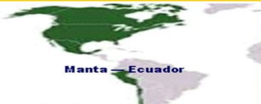
Manta — Ecuador